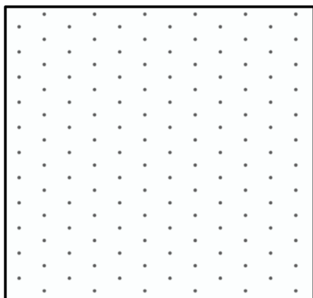
Et rumfang på 16

Tegn figurer med det rumfang, der står under det isometriske papir: